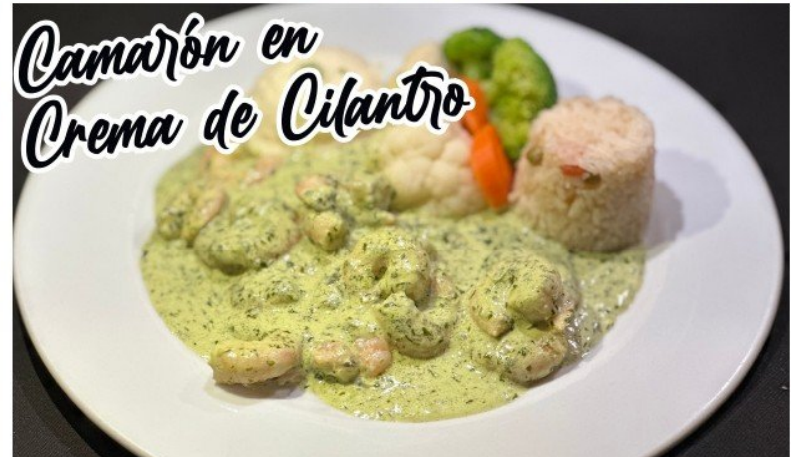
Camarón en Crema de Cilantro