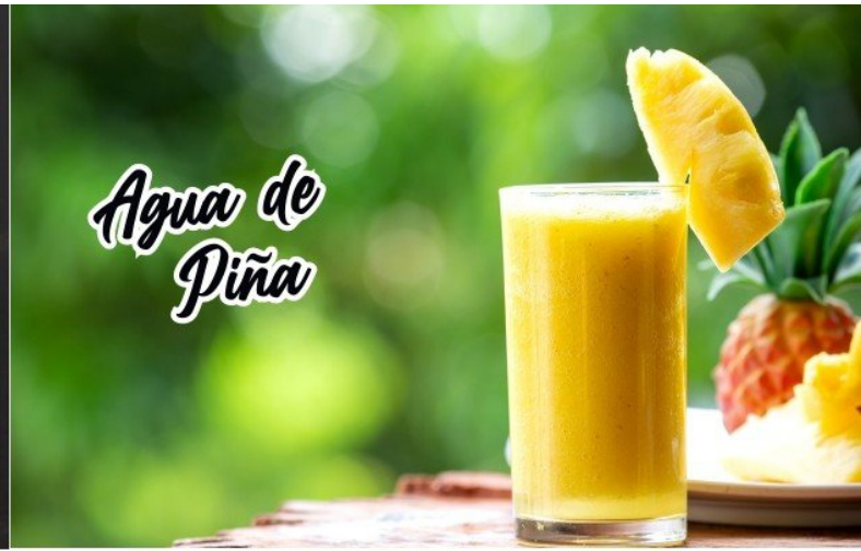
Agua de Piña